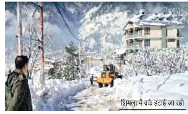
शिमला में बर्फ हटाई जा रही

मंगलवार को यातायात के लिए बंद जम्मू-श्रीनगर राष्ट्रीय राजमार्ग को बुधवार को आंशिक रूप से खोल दिया गया। अधिकारियों के अनुसार बर्फ साफ करने के बाद सड़क को दोनों तरफ से आवाजाही के लिए खोल दिया गया है। इस 270 किलोमीटर लंबे राजमार्ग पर केवल हल्के मोटर वाहनों के आवाजाही की ही अनुमति दी गई है। भारतीय राष्ट्रीय राजमार्ग प्राधिकरण (एनएचआई) के कर्मियों वाहनों को सुरक्षित आवाजाही को सुनिश्चित करने के लिए सड़क पर नमक और यूरिया का छिड़काव कर रहे हैं। बुधवार सुबह हवाई अड्डे पर उड़ानों का परिचालन फिर से शुरू हो गया।