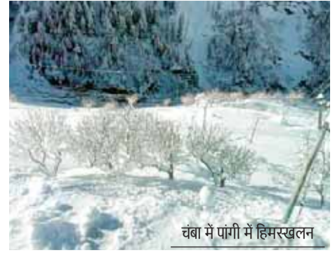
चंबा में पांगी में हिमस्खलन

हिमाचल प्रदेश में भारी बारिश-बर्फबारी के बाद बुधवार को धूप खिली। शिमला, कुल्लू, मंडी, चंबा, किन्नौर, सिरमौर, कांगड़ा जिले के ऊपरी इलाकों ने बर्फ की चादर ओढ़ ली है। मनाली में भारी बर्फबारी हुई है। वहीं शिमला शहर में भी रात को बर्फबारी हुई। पर्यटन स्थल कुफरी, खज्जियार, शिमला, नारकंडा, मनाली बर्फ से लद गए हैं। बर्फबारी से शिमला, कुल्लू, लाहौल स्पीति और चंबा समेत अन्य जिलों में करीब 500 सड़कें अभी भी बाधित हैं।