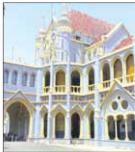
आदेश पर आगामी सुनवाई तक रोक लगा दी।