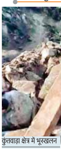
कुंतवाड़ा क्षेत्र में भूस्खलन

श्रीनगर में हवाई अड्डे पर उड़ानों का परिचालन फिर से शुरू