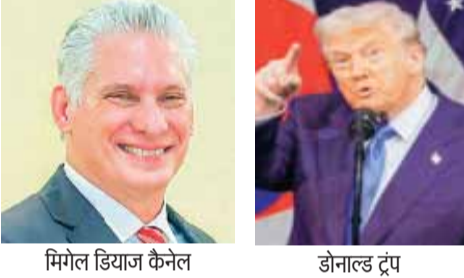
मिगेल डियाज कनेल डोनाल्ड ट्रंप

युद्ध के डर से पेट्रोल पंप और राशन की दुकानों पर लंबी लाइन लग गई